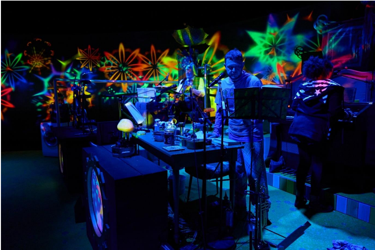
Das Nachtschwarze Meer