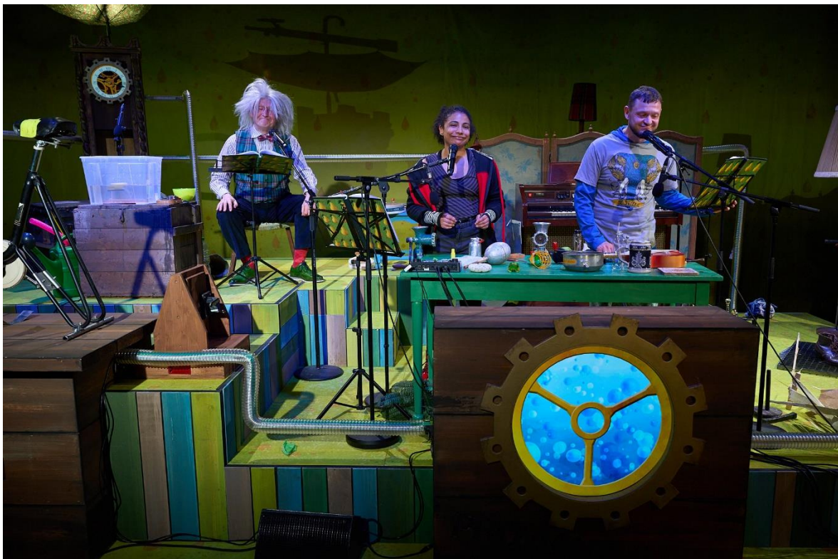
Mika, Sebastian und Professor Glykose machen sich auf den Weg zur geheimnisvollen Insel

Die Birne treibt auf das offene Meer und die drei beschließen, die geheimnisvolle Insel und ihren Bürgermeister HB zu suchen. Sie richten sich häuslich in der Birne ein.