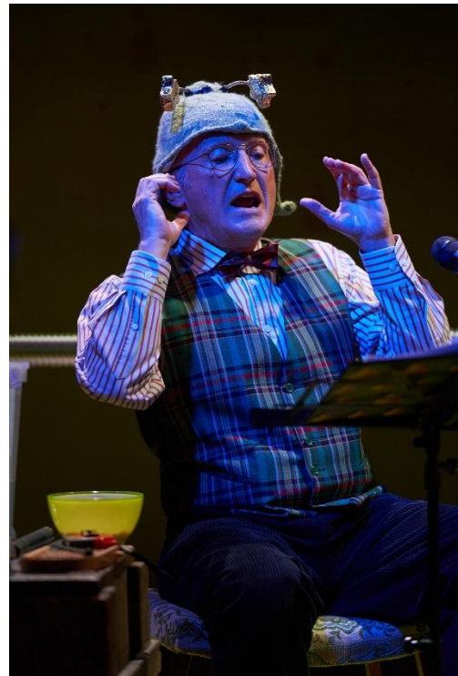
Uropas Stimme ertönt aus seinem Tagebuch

Auf dem Dachboden finden sie die alte Seemannskiste von Sebastians Uropa. Darin befindet sich dessen Tagebuch. In diesem hat Sebastians Uropa eine Karte gemalt und die Hindernisse beschrieben, die es auf dem Weg zur geheimnisvollen Insel zu überwinden gilt. Mika und Sebastian pflanzen den Kern in den Vorgarten und gehen schlafen.